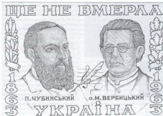
Поштова марка до 100-ліття національного гімну

1963 р. до 100-річчя українського гімну «Ще не вмерла Україна» відділ Організації Оборони Лемківщини видав серію марок, наліпок, франкотипів, поштових листівок із зображенням авторів гімну Павла Чубинського і Михайла Вербицького.