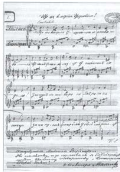
Манускрипт музичної редакції гімну "Ще не вмерла Україна" М. Вербицького

Прим. марка була випущена українською діаспорою в Америці