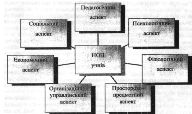
Рис. 1. Структура наукової організації праці учнів

Виходячи з основних положень міждисциплінарного підходу, у розділі обґрунтовано доцільність виокремлення взаємопов'язаних складових НОП учнів: педагогічної (як взаємозв'язок виховного й дидактичного компонентів), психологічної, фізіологічної, соціальної, економічної, організаційно-управлінської, просторово-предметної (рис. 1). Вони актуалізують можливість тлумачення НОП як комплексної категорії з позиції взаємодії різних наук.