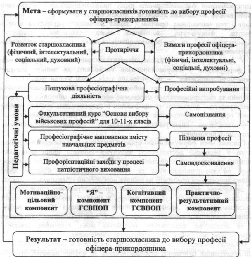
Рис. 1. Модель формування у старшокласників готовності до вибору професії офіцера-прикордонника

Формувальний експеримент було проведено на базі загальноосвітніх і спеціалізованих середніх шкіл протягом двох років. До початку його проведення для забезпечення репрезентативності й однорідності експериментальних груп було здійснено вибірку генеральної сукупності досліджуваної категорії учнів старших класів середніх шкіл. Для цього було залучено дві середні загальноосвітні та дві спеціалізовані школи, спеціалізація яких (право, іноземна філологія та інженерна механіка) споріднена з напрямками підготовки офіцерів-прикордонників у вищому навчальному закладі. Також до початку формувального експерименту було конкретизовано мету експериментального дослідження й укладено Угоду про співдружність і співпрацю між Національною академією Державної прикордонної служби