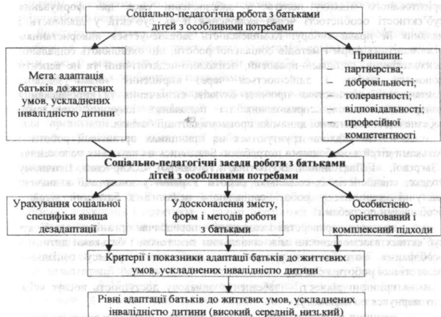
Рис. 1. Схема організації соціально-педагогічної роботи з батьками дітей з особливими потребами

Означені мета і принципи обумовили соціально-педагогічні засади, які визначили зміст, форми й методи експериментальної роботи з батьками дітей з особливими потребами. Ефективність впровадженої роботи була перевірена за допомогою критеріїв і показників адаптації батьків до життєвих умов, ускладнених інвалідністю дитини, які дали змогу визначити рівень такої адаптації.