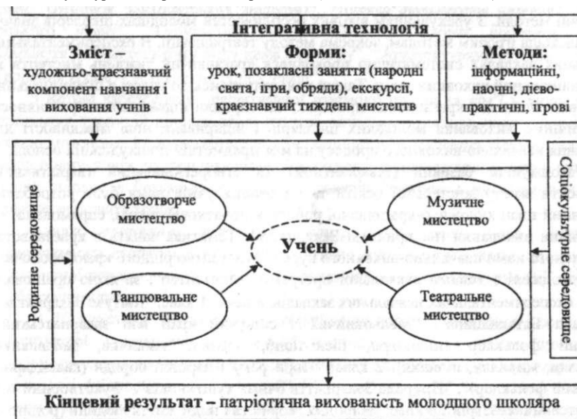
Рис. 1. Модель патріотичного виховання молодших школярів засобами художнього краєзнавства

- забезпечення педагогічної взаємодії школи та сім'ї у використанні мистецьких традицій рідного краю, в єдності професійно-педагогічних і сімейно-родинних виховних впливів, оптимізація виховних можливостей соціокультурного та родинного середовища ( контекстний компонент ).