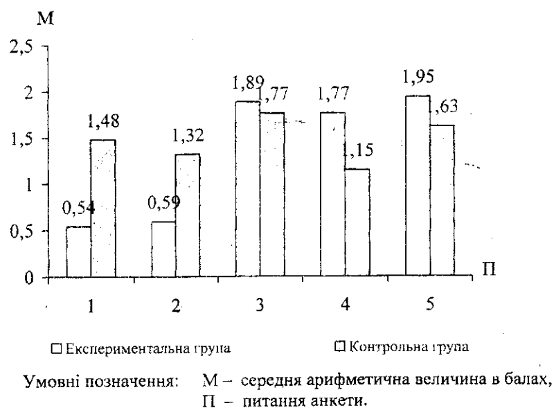
Рис. 1. Результати анкетного опитування студентів дослідних груп (n=150)

Таким чином, як свідчать результати експериментальних досліджень, запропонована нами методика, спрямована на формування комунікативних умінь майбутніх учителів у процесі виховної роботи в оздоровчих таборах, дала позитивний результат, про що свідчить аналіз даних опитування, результати якого подано нами на рисунку 1.