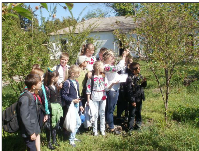
Фото учнів “Миропільської гімназії”