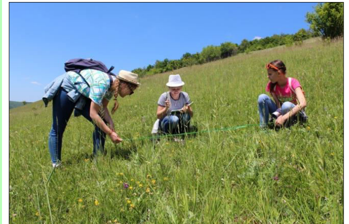
Фото вихованців гуртка "Екологічна стилістика"