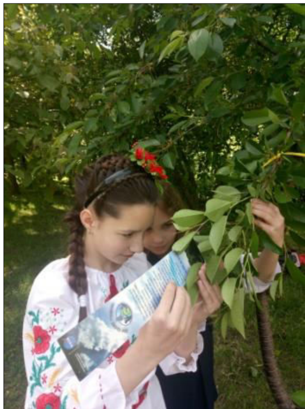
Фото гуртківців "Юні охоронці природи"