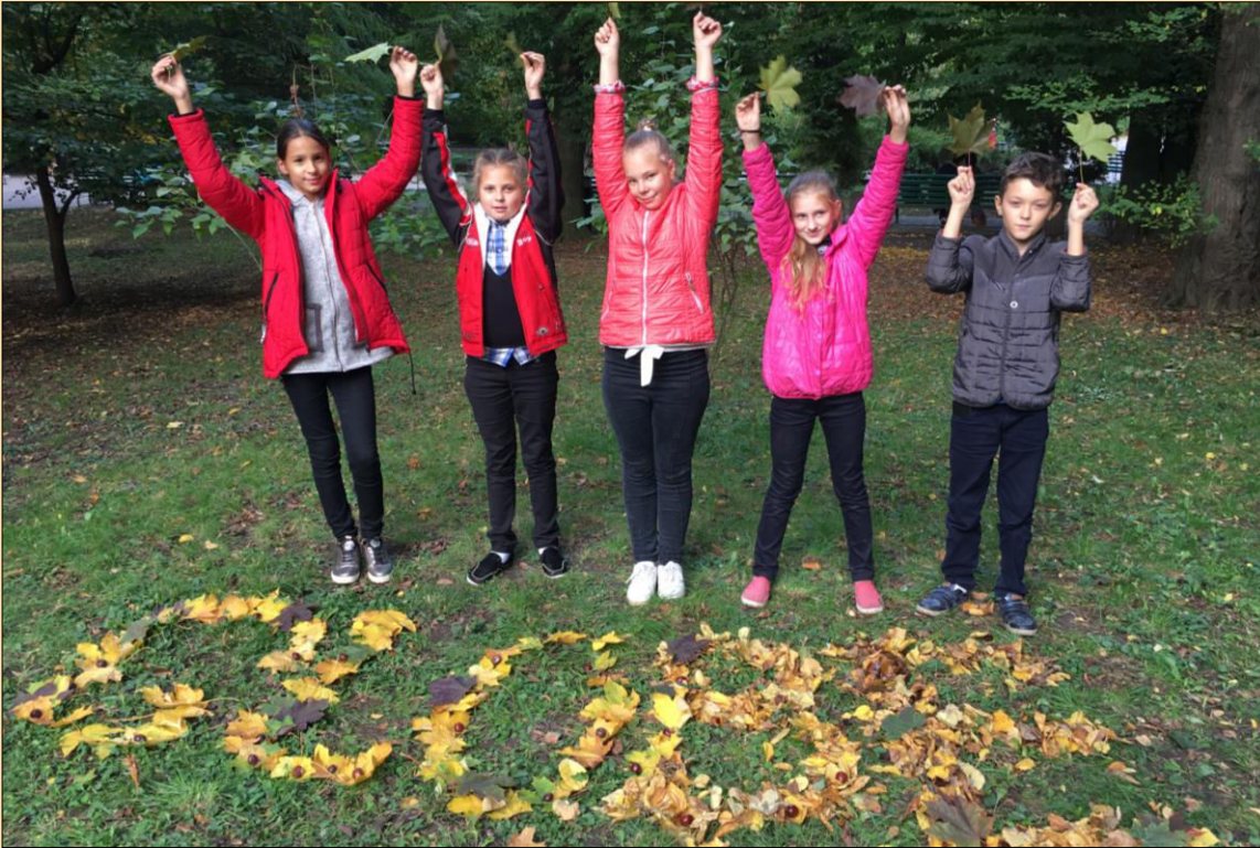
Фото гуртківців “Юні охоронці природи”