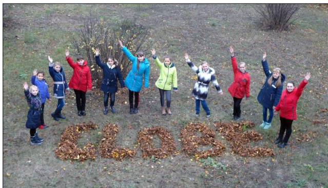
Фото вихованців гуртка “Географічне краєзнавство”