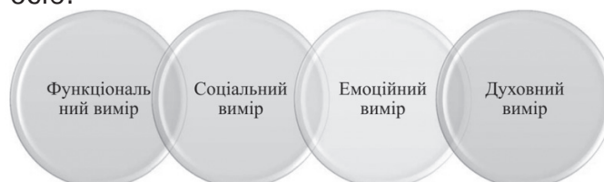
Рис. 1. Виміри поняття «бренд»

Розглядаючи поняття бренду більш глобально, можна виокремити чотири різнозначні виміри, які він поєднує (рис. 1). Перш за все, до основних складників бренду належить функціональний вимір. Він сприймається споживачем, як ступінь корисності того чи іншого продукту або послуги який йому пропонують заклади вищої освіти. В такому випадку джерелом диференціації може виступати історія організації, її майбутні перспективи, технології, рейтинги, клієнти, стилі керування і політика щодо влади і суспільства [1]. Поняття бренду з огляду соціального складника тісно пов'язане із належністю споживачів до певної групи осіб, які об'єднані спільною метою, наприклад, отриманням у кінцевому результаті високого рівня якісних знань. Важливим моментом тут виступають дві протилежні та тісно пов'язані особливості: відчуття індивідуальності й належності до певної групи осіб.