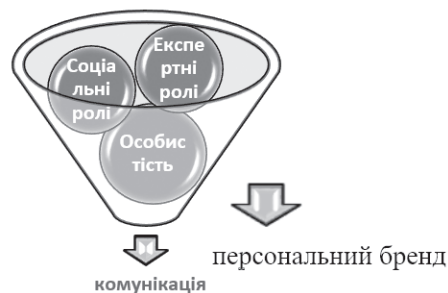
Рис. 2. Формула особистого бренду за А. Олійником

Не менш важливим є емоційний складник у формуванні поняття бренд. Він полягає у тому, щоб вразити уяву споживача. Тобто, не просто зацікавити, а залишити яскравий і оригінальний образ, що закарбується у його пам'яті та змусить повернутись знову. Щодо духовного складника, то він спрямований на використання природної здатності людини відчувати себе не тільки частиною певної групи, а й важливим складником суспільства в цілому. Олійник А. пропонує власну формулу особистого бренду (рис.2):