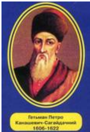
Гетьман Петро Конашевич-Сагайдачний 1606-1622

Ведучий 2: Попід гору доріженька веде, Доріженькою отаманчик іде Отаманчик попереду іде, Козаченьків за собою веде. Марширують України сини І співають всі весело вони: Отамане, отаманчику наш! Веди, батьку, ти на ворога нас! Козаченьки марширують, ідуть, Нехай буде щаслива їм путь.