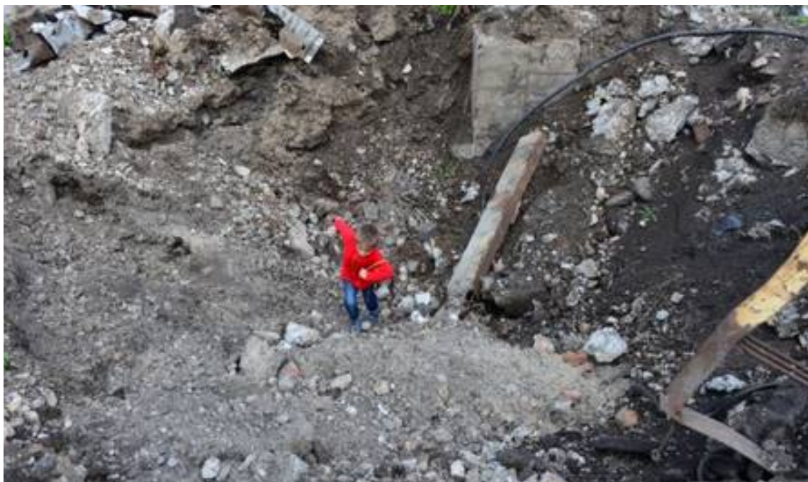
Луганська область. Первомайськ, вересень 2014 року.

під цим документом, а отже, пообіцяла світові піклуватися про своїх маленьких громадян. Здавалося б, для чого це дитині, від чого і від кого треба захищати малюків? Статистика стверджує, що на планеті щоденно 80 тис. дітей помирають з голоду в найбідніших країнах Азії, Африки, Латинської Америки; 40 тис. — від нестачі ліків і медичної допомоги. Дітей підстерігає неписьменність, непосильна й багатогодинна робота заради шматка хліба, різні хвороби, нещасні випадки, грубість дорослих, а часом — і жорстокість батьків. Зараз на сході України – надзвичайно критична ситуація