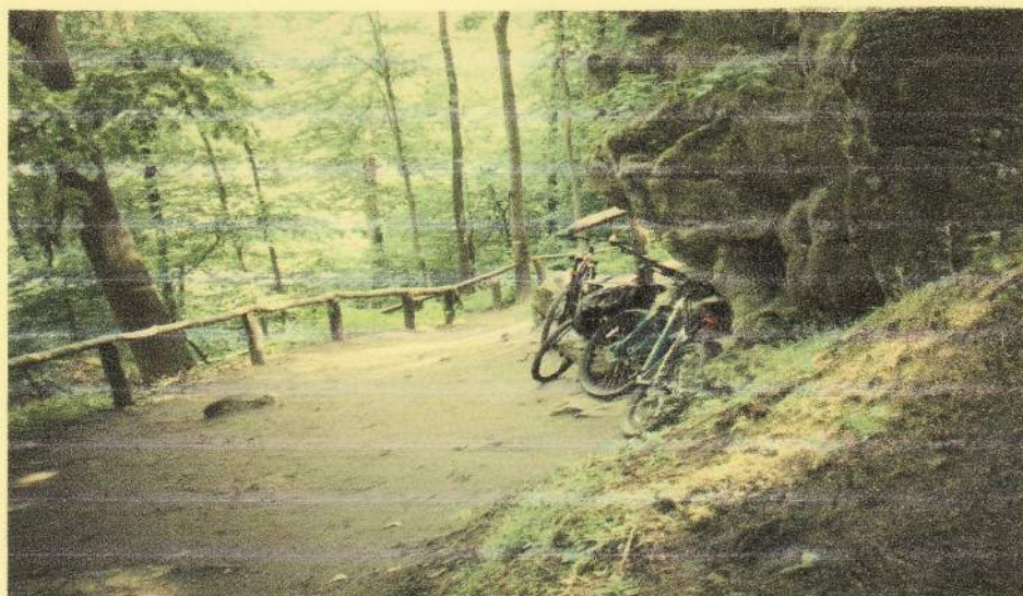
(фото №5. «Висоти , гори»)