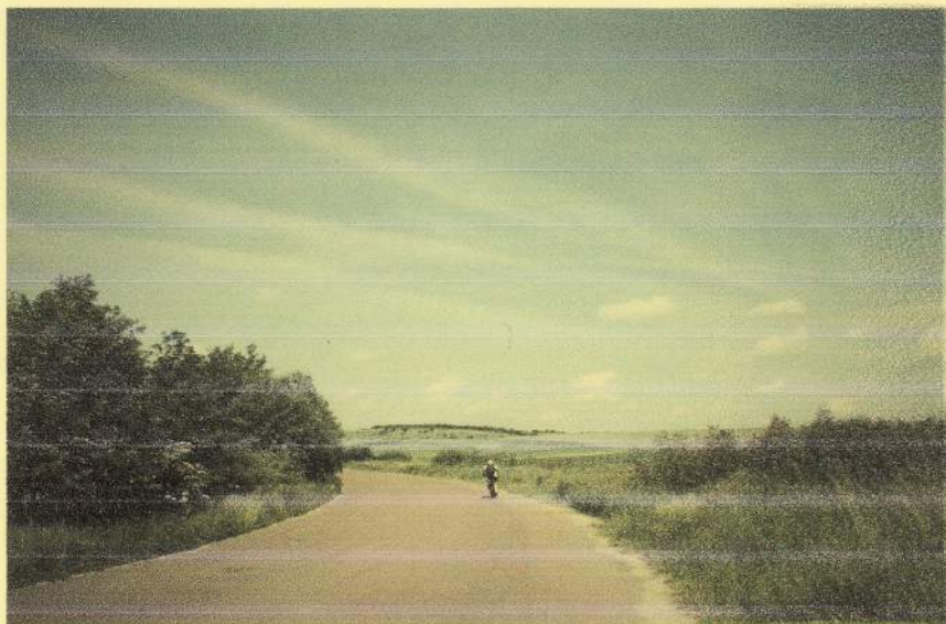
(фото №2. « Подорож триває»)