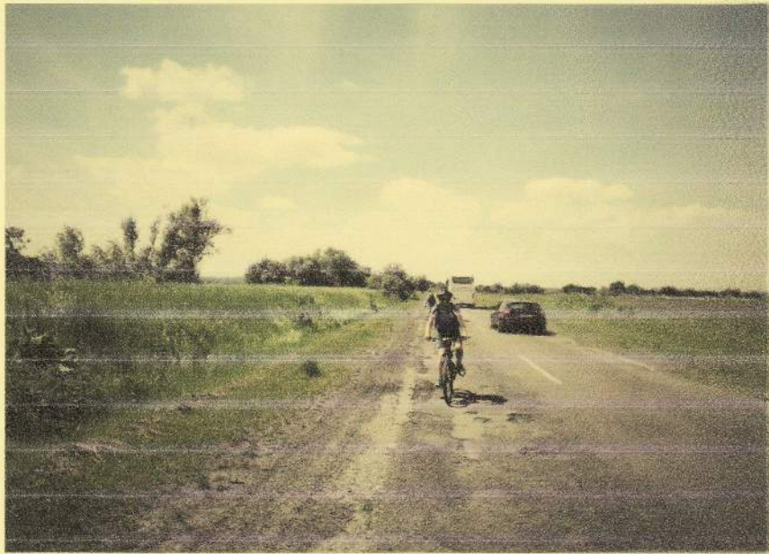
(фото №1. « Початок подорожі»)