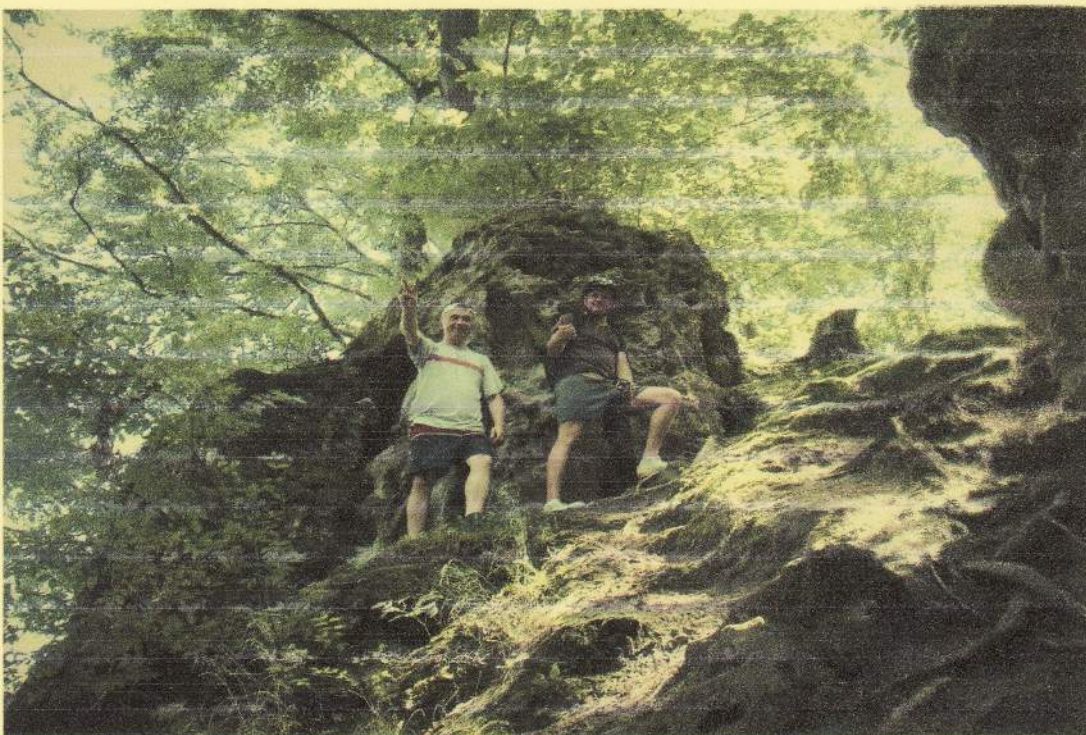
(фото №4. « Висоти , гори» )