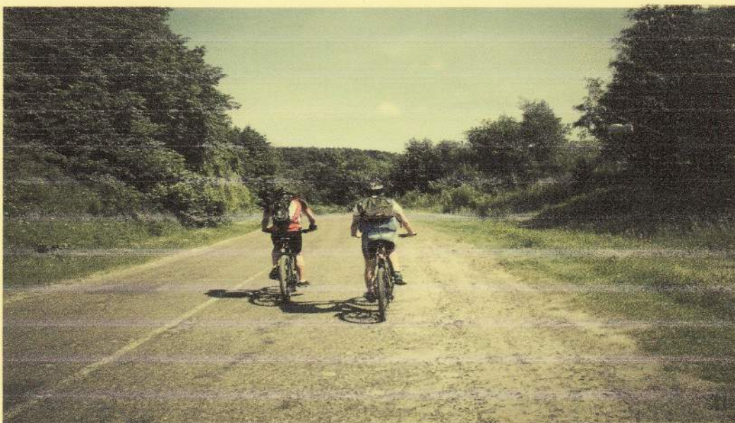
(фото №3. « Природа Яремче»)