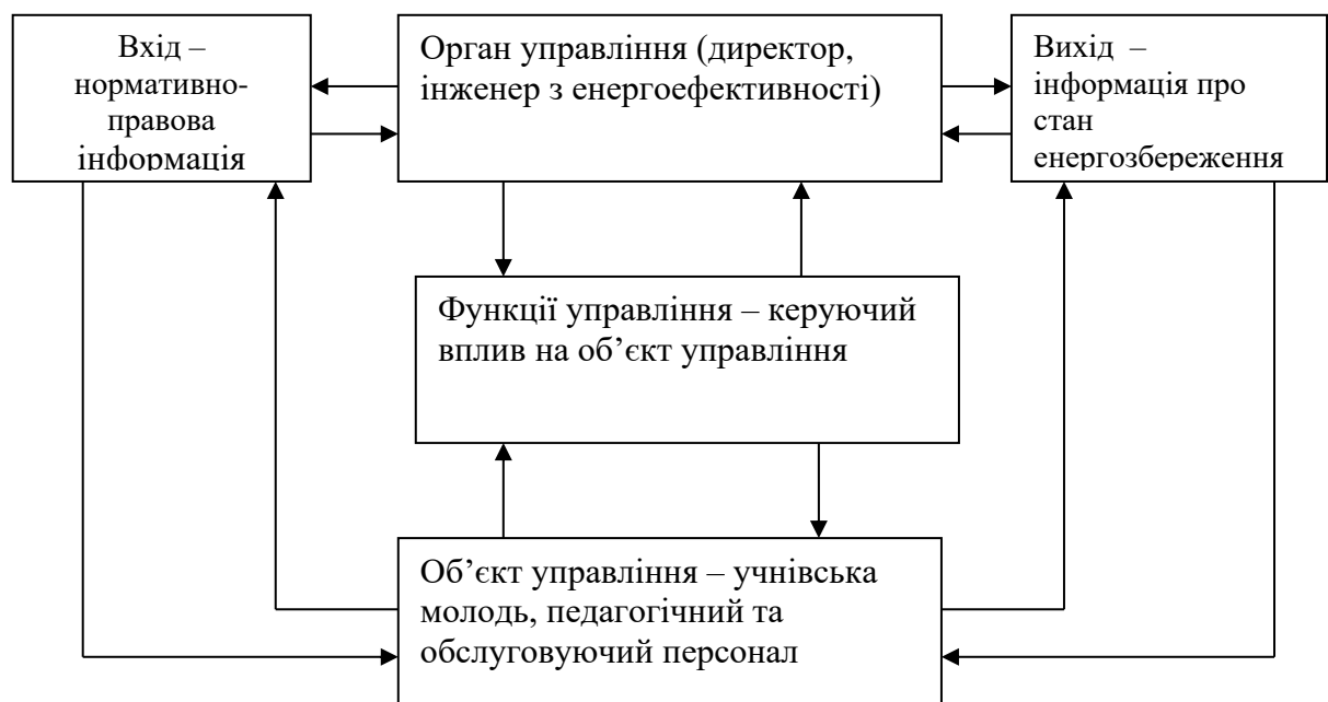
Схема управління енергозбереженням та енергоефективністю.

Зв'язок елементів системи між собою досягається за допомогою усної інформації, письмових повідомлень, звітів, довідок тощо.