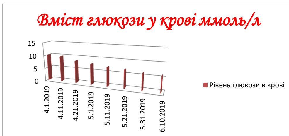
Рисунок 1 - Дані дослідження впливу відвару стевії на рівень глюкози в крові

Аналізуючи графік, можна дійти до висновку, що відвар стевії при застосуванні в комплексній терапії цукрового діабету II типу допомагає знизити рівень глюкози в крові майже на 30% завдяки заміщенню глюкози стевіозидом.