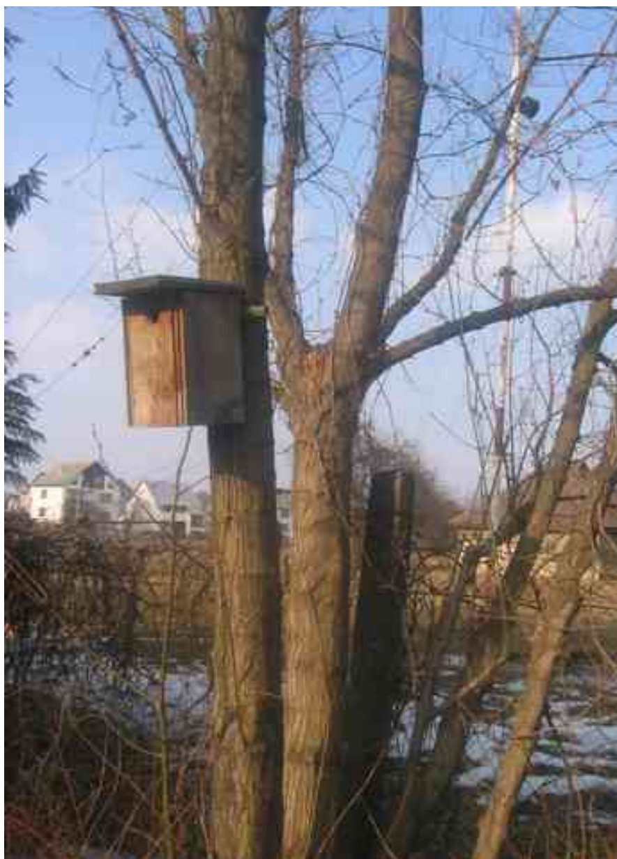
Фото і малюнки автора