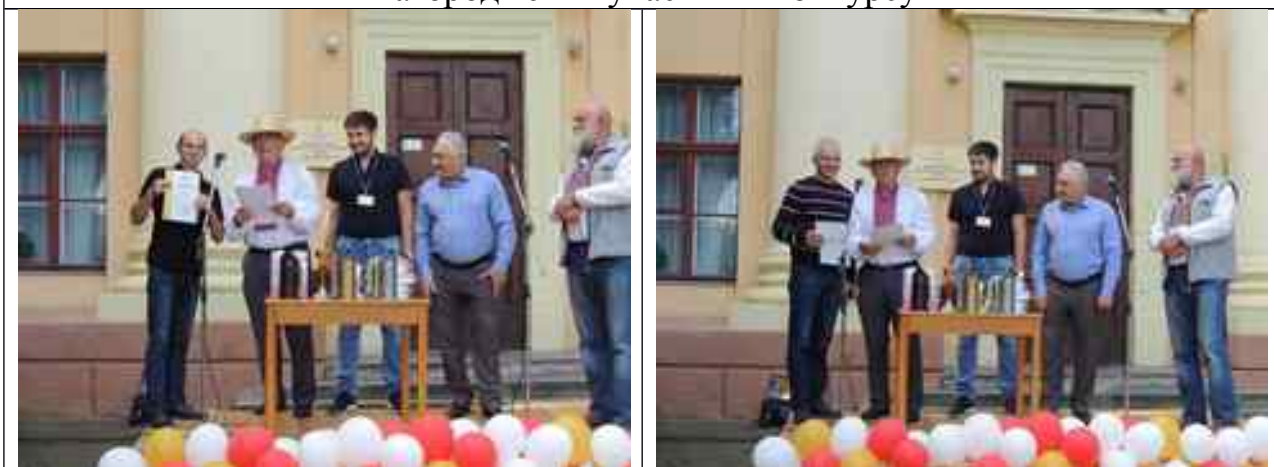
Та вручення подяк керівникам команд