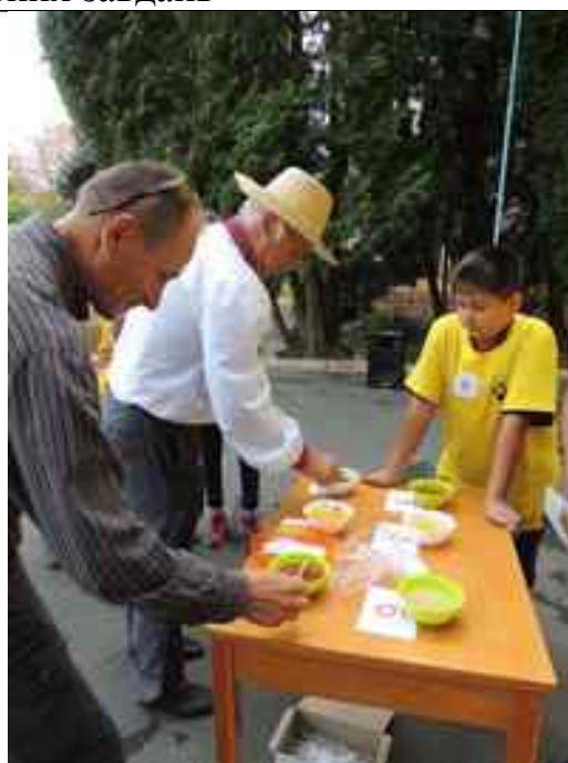
Медовий конкурс (визначення медів)