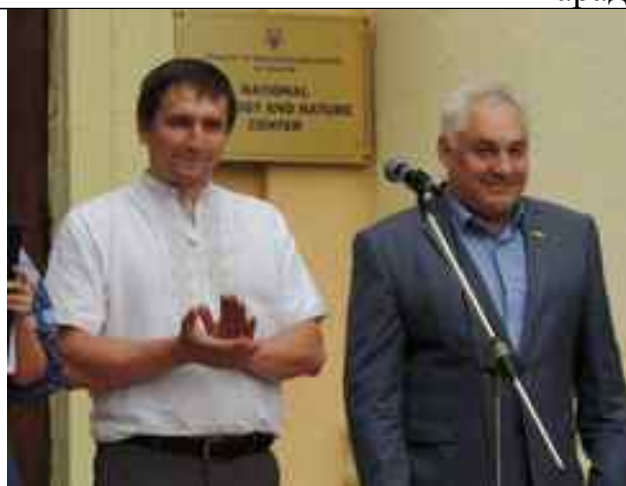
Привітання учасників конкурсу