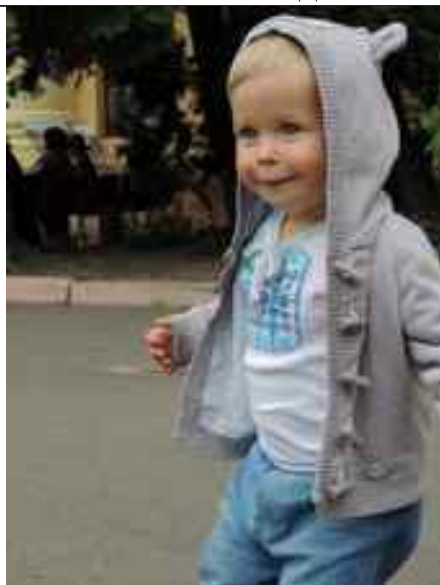
Наймолодший учасник фестивалю