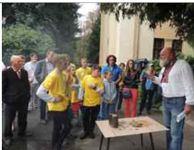
Виконання конкурсних завдань