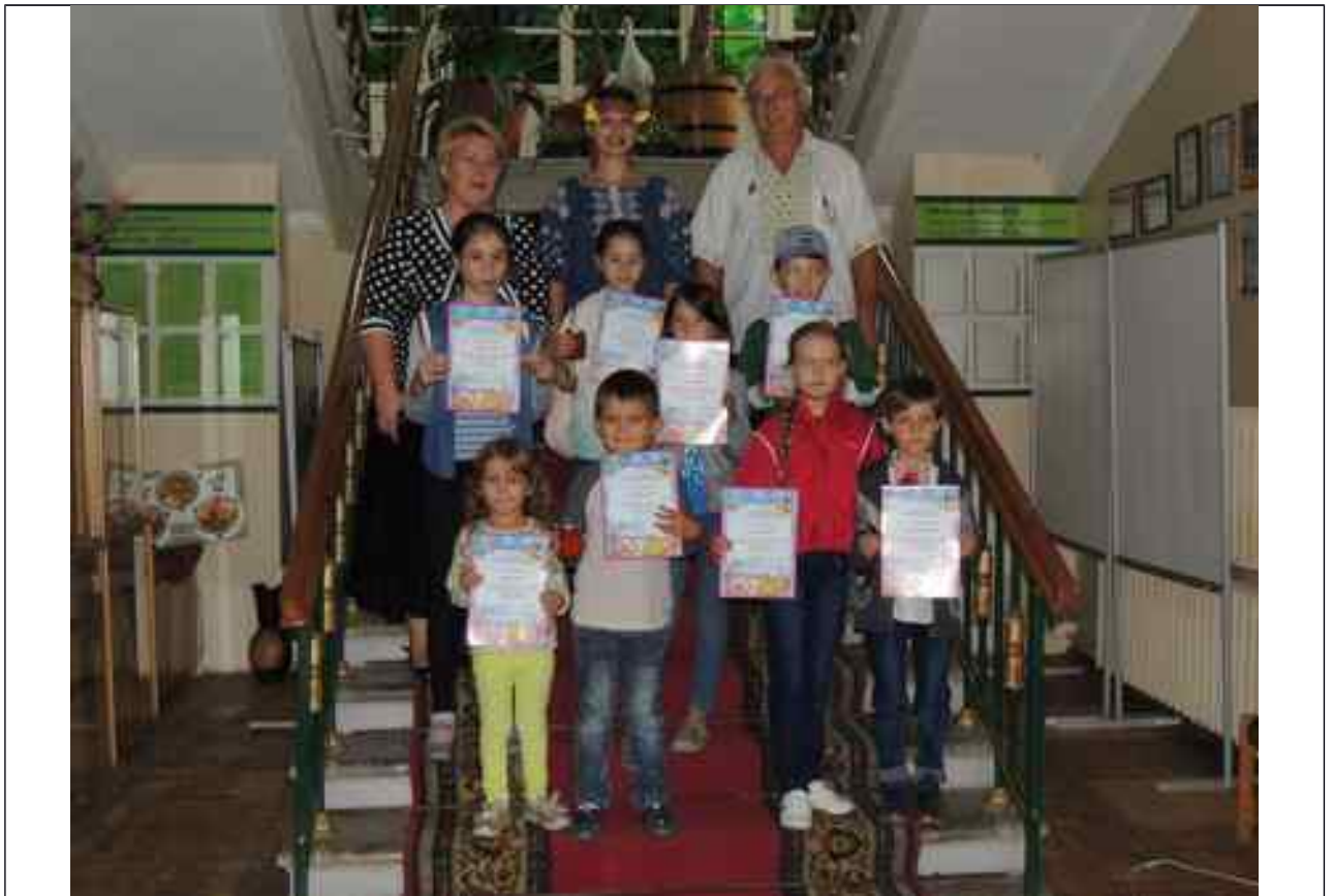
Та його лауреати