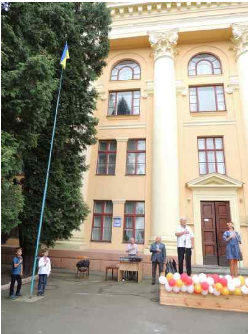
Підйом прапора наймолодшими учасниками команд