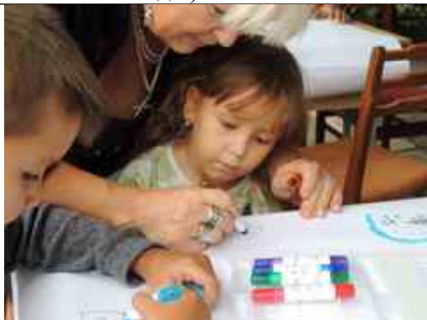
Конкурс дитячого малюнка