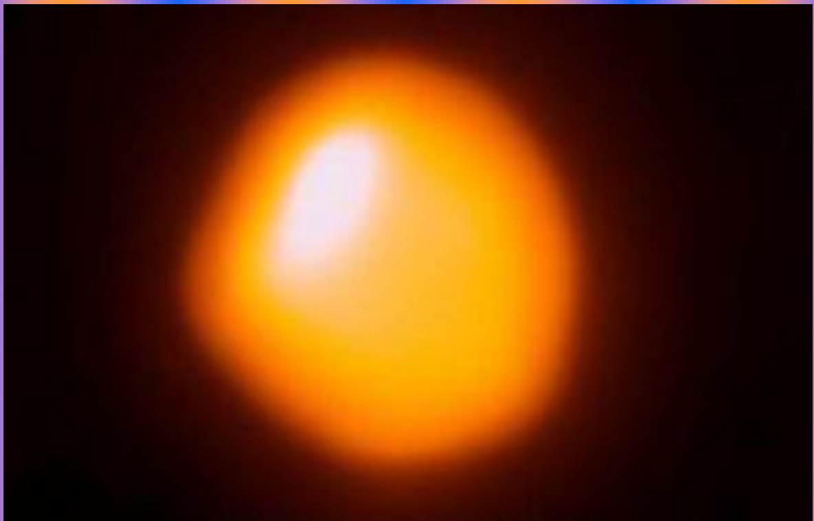
Зоря альфа Оріона