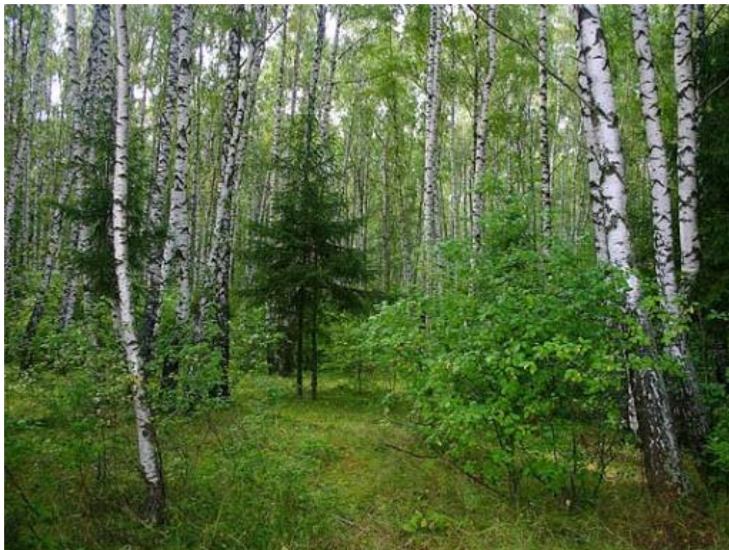
Мал. Мішаний ліс