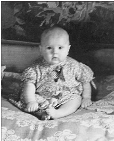
Мені один рік. Перше слово маляти ще попереду.