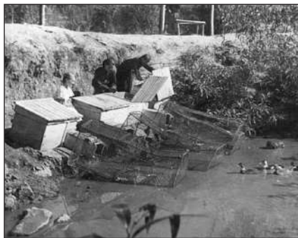
На шкільній фермі пернатих і хутряних.

А ще іноді він водив мене рибалити на річку Калюс. Ці подорожі завжди були захоплюючими цікавими і пізнавальними. Батько розповідав, як за народними прикметами можна передбачити погоду, про різні рослини, які зустрічалися на шляху, а ще історії зі свого дитинства, зокрема, про те як одного разу вони з братом пустили з гори величезного каменя, що мало не влучив у будинок і не наробив лиха. Тут він був розкутий, веселий, дотепний, звичайний, простий і зовсім не нагадував суворого і недоступного Федора Степановича, якого всі чомусь остерігалися.