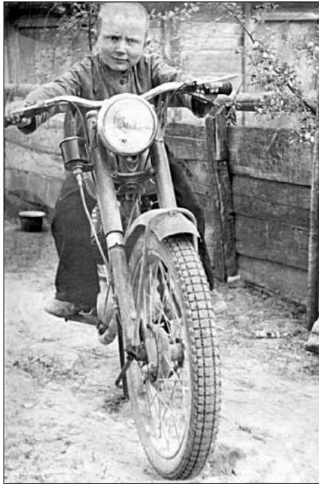
Цю світлину надіслав братові 06.04.1957 року.