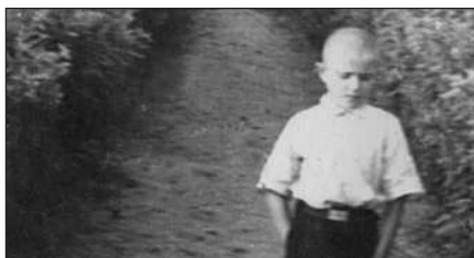
Алея, яка подобалась в дитинстві.

мені в навчанні, вчив мислити і робити висновки, не нав'язував свої погляди та давав право вибору. Важко перечислити все те, чим він допоміг у моєму становленні. Як і мати, він дуже мене любив і вірив у мої успіхи.