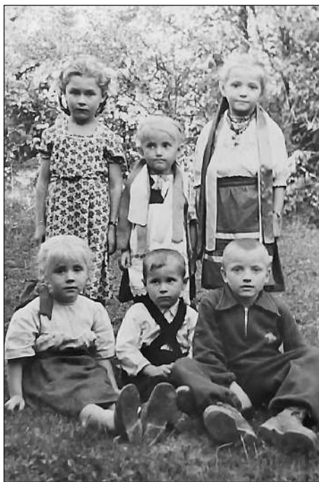
Тут і тітка, і брати, і сестри.