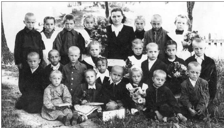
Перше вересня 1957 року. Третій ліворуч серед тих хто стоїть.

На мою думку, відвертість притаманна лише сміливим людям або в ситуації, коли вже нашкодити собі складно. Справжніми сенсаціями для обивателів стали одкровення багатьох відомих людей, які щиро зізнавалися, що були наркоманами, п'яничками, боягузами, хворіли на СНІД чи зазнавали сексуальних домагань. Мода на такі сміливі заяви пішла із Заходу і до нашого постсовкового простору дійде не швидко. Ми ж бо скільки років слухали пропагандистські речі про те, що треба бути героями, а в реальному житті бачили здебільшого зовсім не звитяжне, а ганебне, бо не гасла, а буття визначає свідомість. Та тих, хто сподівається знайти в моїй сповіді щось пікантне, розчарую, нічого такого я не переживав, а придумувати не хочу. Достатньо об'єктивності.