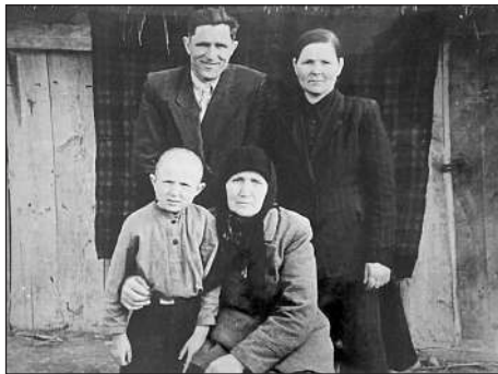
Наймолодший в сім'ї.

На той час, про який йдеться в моїй розповіді, близьких друзів у бабусі було обмаль. Щиро й відверто спілкувалася вона лише з рідними сестрами і то не з усіма. З її слів знаю, що до війни найближчими товаришами й товаришками у неї були євреї. Вони мешкали поруч з нашою оселею в центрі села і працювали