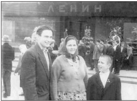
З братом і мамою у столиці.

Наше подальше знайомство з Москвою нічим оригінальним не відзначалося. Як і всі гості столиці, ми традиційно відвідали Червону Площу, Кремль і Мавзолей, Могилу невідомого солдата в Олександрівському саду, панораму Бородинської битви на Кутузовському проспекті, всесвітньовідомі Третьяковську галерею і Оружейну палату. Але на відміну від мільйонів туристів, які переважно наспіх знайомляться зі столицею у складі туристичних груп, ми мали змогу робити це не спішно, більш детально та без метушні. Кілька разів були у Парку культури і відпочинку імені Максима Горького, каталися на комфортабельному катері по Москві-ріці, побували на могилах Миколи Гоголя, Андрія Булгакова, Володимира Маяковського, Леоніда Утьосова, Федора Шаляпіна, Володимира Вернадського та інших знаменитостей на Новодівочому кладовищі (тоді воно ще було відкритим для відвідин усіма охочими). В межах культурної програми дивилися «Стряпуху» в театрі Сатири і циркову виставу на Цвітному бульварі за участю Юрія Нікуліна, а також ходили з братом на футбол у «Лужники», де насолоджувалися грою моїх тодішніх кумирів – Едуарда Стрельцова з «Торпедо» та динамівця Льва Яшина.