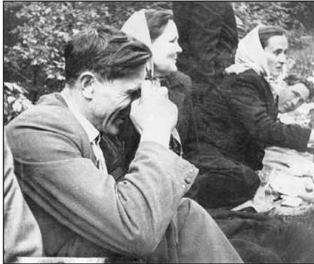
Батьки на маївці у колі друзів.

заглянути в ту його частину, де вже дозрівали черешні або на плантацію із суніями. Та відомча охорона не дрімала і пильно стежила за ватагою. Переважно ми залишалися ні з чим, бо всі спроби відволікти сторожів терпіли крах. Але іноді дещо таки перепало, здебільшого тоді, коли в нашій компанії був родич когось із охоронців.