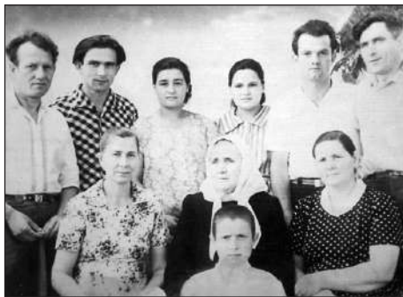
Велике сімейне зібрання.