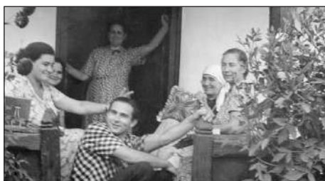
Щаслива мить в сімейному колі.