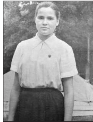
Сестра на обласних змаганнях з туризму.

Я забивався десь у закуток, щоб мене менше хто бачив і була не прогнан, та й уважно слухав дівочі секрети. Це вам розмови не про алгебру чи географію, тут, як повезе, можна було почути таке сокровенне... Особливих моральних пересторог, таких як те, що не можна підслуховувати чужих розмов, у зовсім юному віці у мене ще не було, то ж я принишкав і від надмірної уваги аж розкривав рота, щоб була чогось важливого не пропустити.