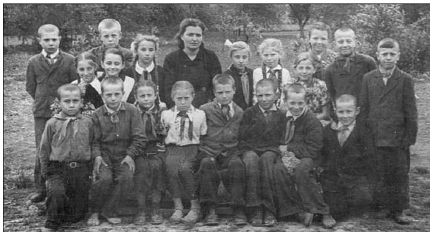
Молодша школа, випускне фото.

Ще одна непересічна подія. Навесні 1961 року батьки перебралися у новозбудоване помешкання. На той час це був один із найкращих житлових будинків у нашому селі. У так званому «фінському будиночку», який ми звели, були вітальня, зала, спальня, кухня, ванна кімната та дві веранди. Це було щось неймовірне у порівнянні з невеликою кімнатою і кухонькою у бабусиній хаті, де ми вп'ятьох мешкали до того. І тут я знову вживатиму поняття «ментальність». Саме ментальність завадила батькові зробити революційний крок. Досі не второпаю, як