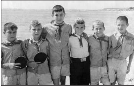
На морі. Стою праворуч.

Хоча моє харчування вдома теж було непоганим, але такого різноманіття страв із риби та морепродуктів, млинців, млинчиків, запіканок, суфле та інших десертів раніше не тільки не коштував, але й не бачив і не підозрював про існування такої смакоти. Від тієї пори і до нині я обожаю