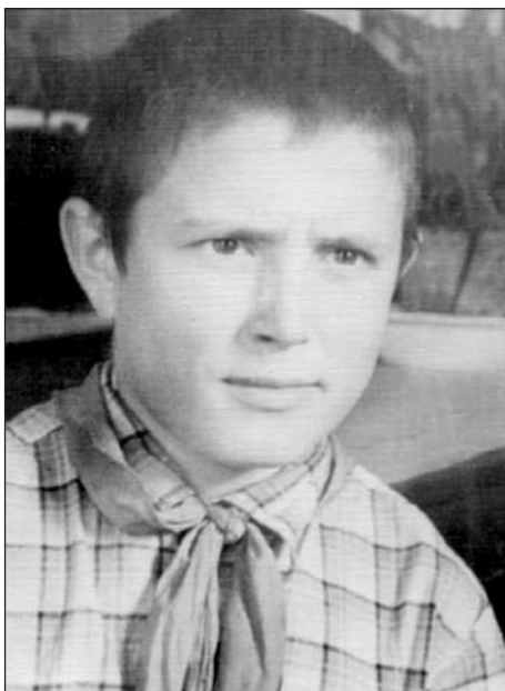
Таким я був у незабутньому 1961 році.

Ще одна непересічна подія. Навесні 1961 року батьки перебралися у новозбудоване помешкання. На той час це був один із найкращих житлових будинків у нашому селі. У так званому «фінському будиночку», який ми звели, були вітальня, зала, спальня, кухня, ванна кімната та дві веранди. Це було щось неймовірне у порівнянні з невеликою кімнатою і кухонькою у бабусиній хаті, де ми вп'ятьох мешкали до того. І тут я знову вживатиму поняття «ментальність». Саме ментальність завадила батькові зробити революційний крок. Досі не второпаю, як