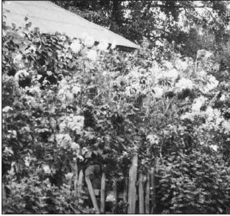
Бабусине захоплення й гордість.

неповторний запах, коли їх зірвати і потерти в руках або покласти в окріп. Очевидно, мене теж купали в цьому зіллі, тому воно так мене притягувало. Терти в руках м'яту, любисток чи полин, а потім нюхати позеленілі долоні — ця звичка зі мною й донині.