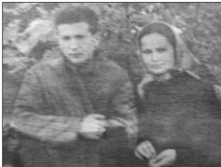
Брат і сестра.

Коли я підріс, то для сестри і брата необхідність «сидіти з дитиною» відпала. Очевидно, так було краще для нас усіх. Те, що вони мене дуже любили, було безсумнівним, як і те, що я до певної міри заважав їм займатися улюбленими справами чи спілкуватися з друзями. Може через це й траплялися зі мною різні ка-