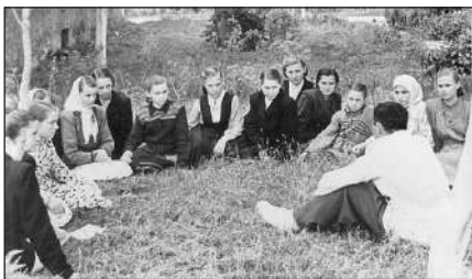
Метод бесіди – одна з налюблениших форм викладання і тема наукових досліджень батька.