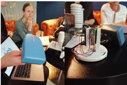
(Представники Нідерландів презентують апарат, завдяки якому вимірюють забруднення повітря.)

Викладачі ділились досвідом проведення досліджень в рамках програми.