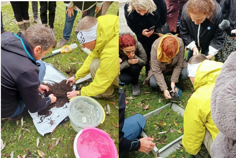
(Тренінг про кільчистих червів та родючість ґрунтів)