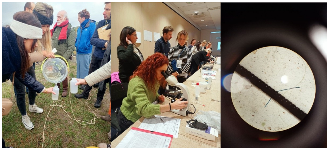
(Тренінг з пошуку мікропластику в річці Дагава)

Для вчителів були представлені різноманітні екологічні тренінги на вибір: дослідження родючості ґрунтів; змінам клімату; новими технологіями; зондування землі; дослідницькому навчанню; вивчення забруднення повітря аерозолями та парниковими газами; знаходження мікропластику у воді та його дослідження наслідків; питання фенології та методиці її проведення; біомімікрія; вплив пожеж на клімат.