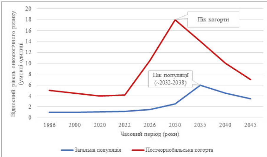
Рис. 2. Прогностична модель динаміки онкологічного ризику в Україні: порівняльний аналіз латентних періодів для загальної популяції та осіб із обтяженим радіаційним анамнезом (ефект скорочення латентного вікна)

Для зони переважно хімічного навантаження (Схід та Південь) очікується ранній пік, зумовлений гептил-асоційованими процесами з латентним періодом 5–15 років (2027–2037 рр.) [3]. Динаміка піків представлена на Рис. 2.